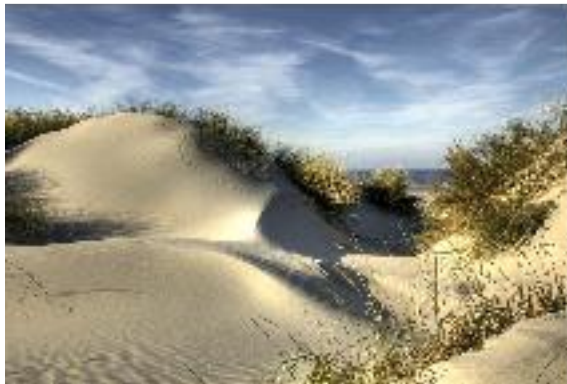
Dunes de sable

La côte atlantique propose des paysages variés. La préservation des milieux naturels représente t'elle un enjeu majeur ?