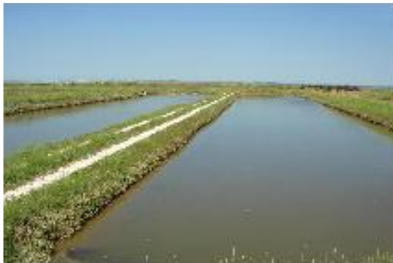
Marais ostréicoles (claires)

Un environnement caractéristique du pays Marennes-Oléron qui mérite que tout soit mis en œuvre pour sa protection