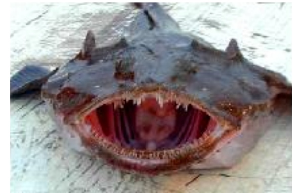
Une lotte : poisson des côtes atlantiques

Le biotope et la biocénose constituent un écosystème