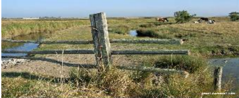
Marais d'eau douce (agricole)