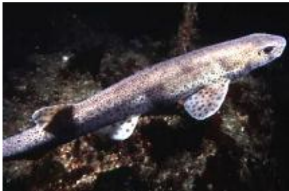
Une roussette : poisson des côtes atlantiques