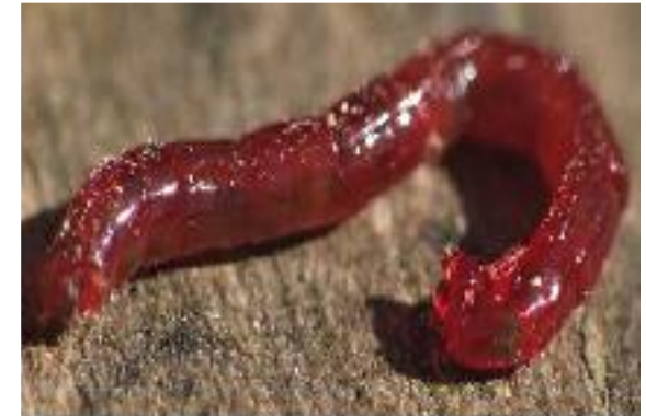
Ver de vase