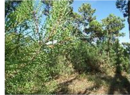
Forêt de pins maritimes