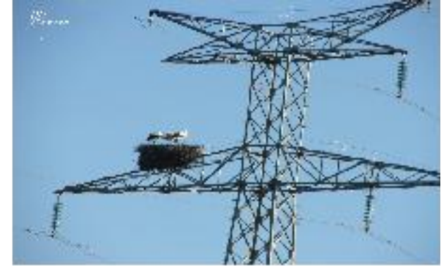
Nid de cigognes sur les pylônes électriques au dessus des marais d'eau douce