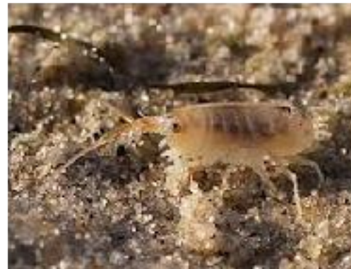
Une puce de sable